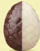
Praliné avec éclats de noisettes