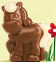
Moelleux au chocolat