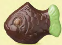
Praliné croustillant aux éclats de crêpe dentelle