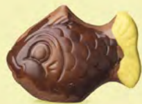
Praliné et noix de coco caramélisée