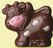
Praliné avec sucre pétillant