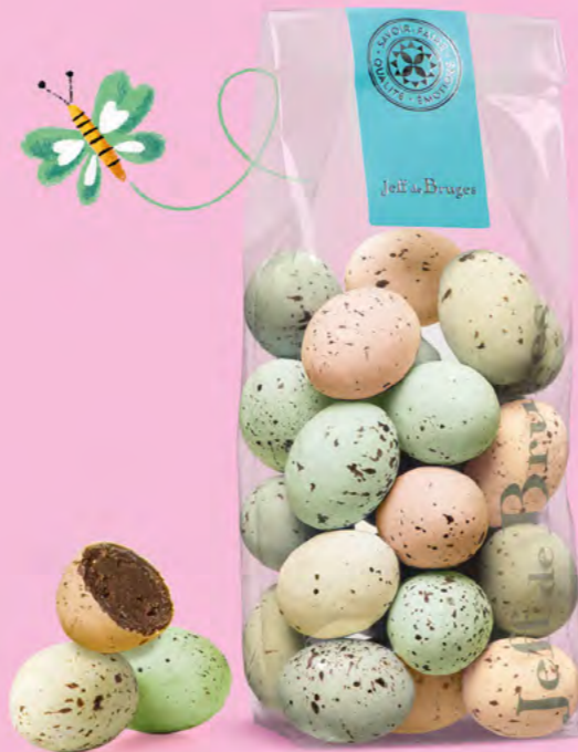
Praliné tendre ou praliné et éclats de crêpe dentelle