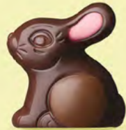
Praliné et éclats de noisettes caramélisées

NOS petits animaux en chocolat sont "presque" trop mignons pour être croqués !