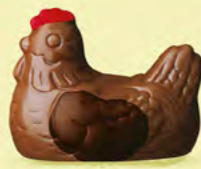
Duo praliné et ganache caramel